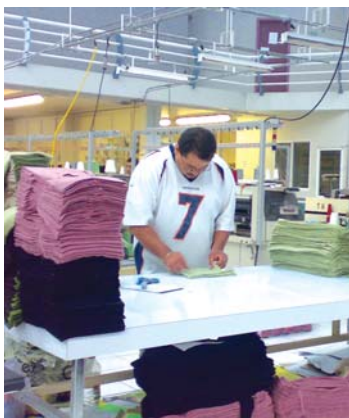
Buscan apoyos por 200 millones de pesos.

La funcionaria dijo que dichos recursos se van a destinar, por una parte, para