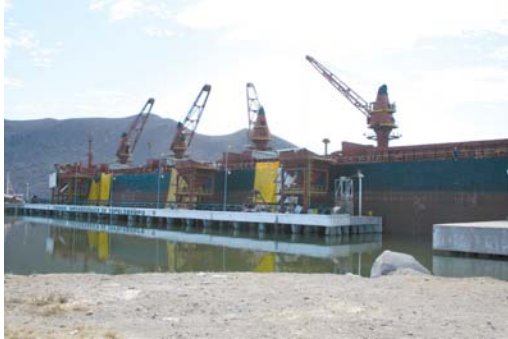
Estará dedicada a la industria maquiladora de Chihuahua.

Dichos recursos, dijo, forman parte de 600 millones de pesos que se han asignado a este recinto para todo el sex-