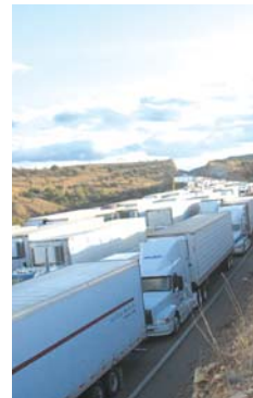
Sólo 22 mexicanas.

Con base en lo acordado por los gobiernos de México y Estados Unidos, ninguno de los dos países podría contar con más del 140% del total de empresas que la otra nación tuviera registradas, así, mientras que las firmas estadounidenses no partici-